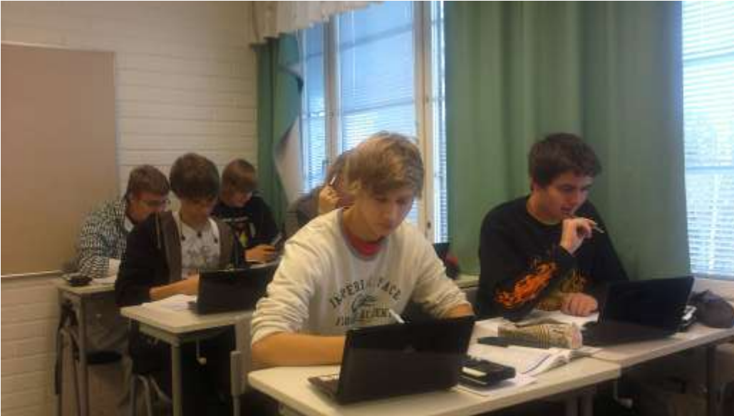
Kuva 3. Turun Lyseon lukion opiskelijat matematiikan tunnilla

Lähes kaikilla Turun Lyseon lukion opiskelijoilla on samanlaiset laskimet. Tällöin erilaisten apuvälineiden käytön opiskelemiseen ei kulu aikaa. Miniläppäreitä ei kuitenkaan joka jaksossa riitä matematiikan opiskelijoiden käytössä, joten pelkästään niiden varaan ei voida opetusta rakentaa.