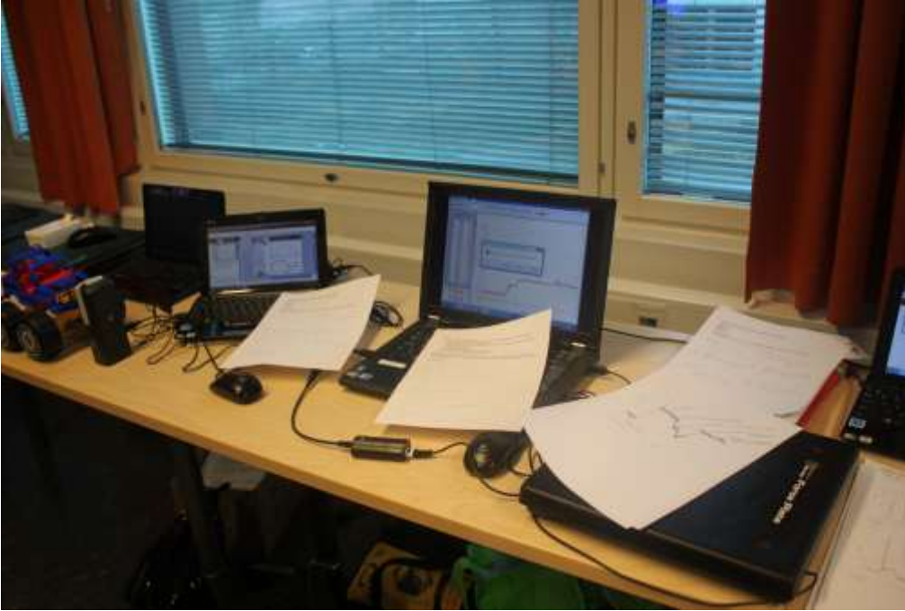
Kuva 5: Mittauslaitteisto: tietokone, ultraäänianturi, voimalevy