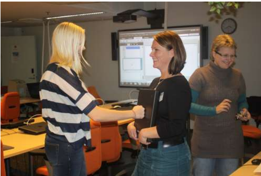
Kuva 4. Fysiikan riemua impulssia tutkiessa.

Tunnilla suoritettavien kokeiden tulisi olla hyvin suunniteltuja ja tarkkaan harkittuja, ei vain kokeita kokeiden vuoksi. Siksi mielestäni kaikkia kokeellisia töitä ei tarvitse kerralla muuntaa antureilla suoritettaviksi, vaan ne voi kätevästi yhdistää perinteisiin demonstraatiovälineisiin ja antureita voi ottaa vuosi vuodelta yhä enemmän oppilaiden käyttöön. Olemmekin Lyseon lukion fysiikan tunneilla yhä tutkineet kitkaa jousivaaioilla, valosähköilmiötä UV-lampulla ja erilaisten valonlähteiden spektrejä spektrometrillä, erilaisia mikroskooppikuvia jne. Samalla on tullut mietityksi, miten näitä uusia laitteita saisi seuraavalla opetuskierröksellä vielä paremmin mukaan. Oppilaat ovat jo aktiivisesti käyttäneet antureita, joten oppilaiden kotona suorittamat työt ovat olleet kaikki vain plussaa aiempiin opetuskokeiluihin nähden. Kotona tehdyt työt, kun voivat olla myös kokeita kokeiden vuoksi, ihan vain pitämässä opiskelijan ajattelua ja kiinnostusta fysiikkaan yllä. Opiskelijat ovat hoitaneet laitteita hyvin ja kysyneet neuvoa tarvittaessa, joten laitteiden kotiin lainauksessa ei ole esiintynyt ongelmia.